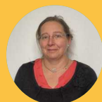
Blandine VAN DYK Maire de Saint Hippolyte