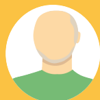
Jean-Paul MALBEC Maire de Saint Bonnet de Condat