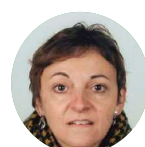
Chrystèle SERRE Maire de Montboutif