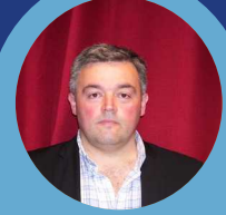
Christophe RAYNAL Maire de Cheylade